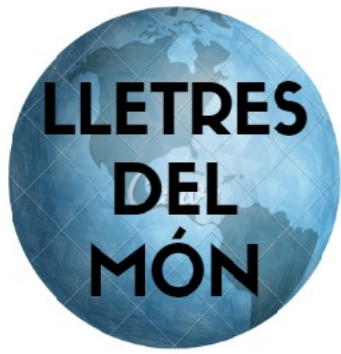
1r ESO A